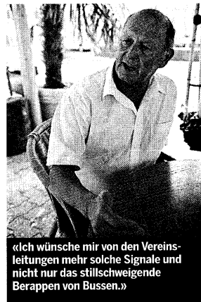
«Ich wünsche mir von den Vereinsleitungen mehr solche Signale und nicht nur das stillschweigende Berappen von Bussen.»

Die Polizeivertreter scheuen sich davor, im Stadion selber verstärkt aufzutreten. Sie sagen, für die Sicherheit im Stadioninneren seien die Vereine zuständig.