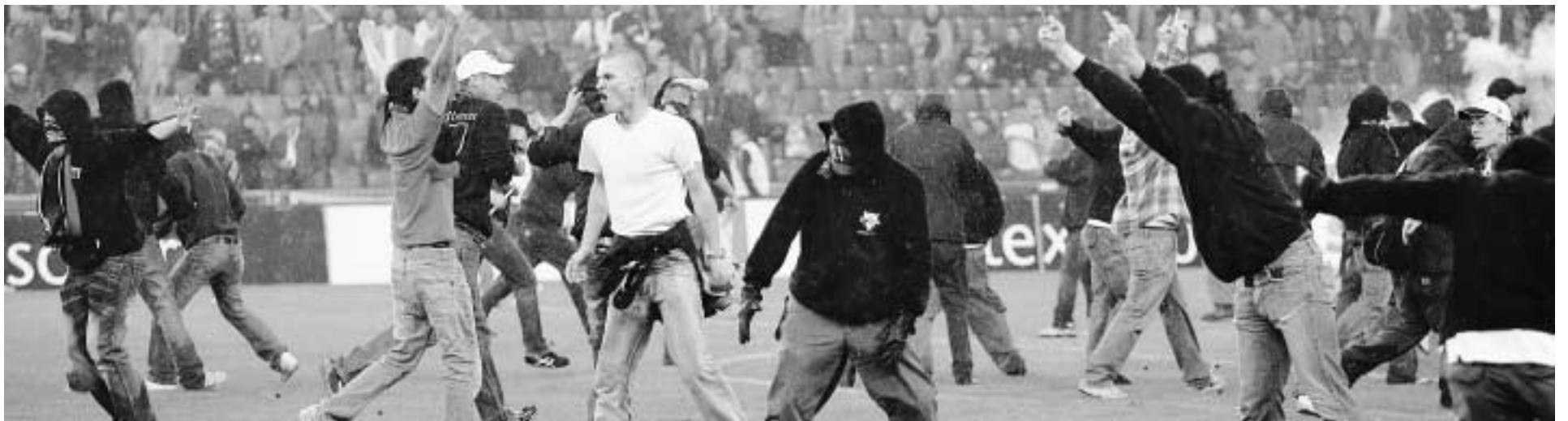
KRAWALLE. Die Ausschreitungen nach dem Match FC Basel–FC Zürich haben Fassungslosigkeit und Empörung hinterlassen. Über 100 Verletzte, 25 Festnahmen und ein Schaden von rund einer halben Million Franken: So lautet die Bilanz der Krawalle von vor einer